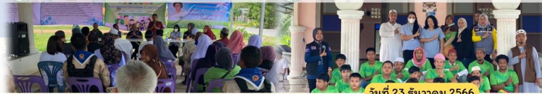
วันที่ 23 ธันวาคม 2566