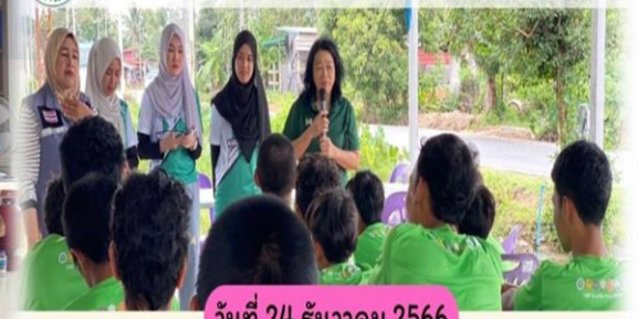
วันที่ 24 ธันวาคม 2566